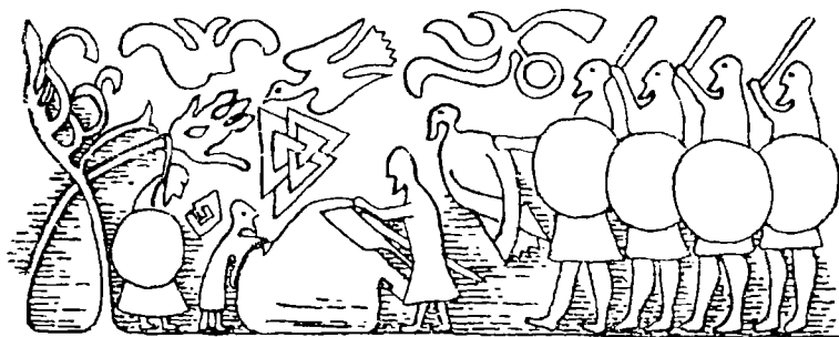
7.26. Прорисовка изображений на одном из скандинавских поминальных камней. В центральной части композиции — валькнут